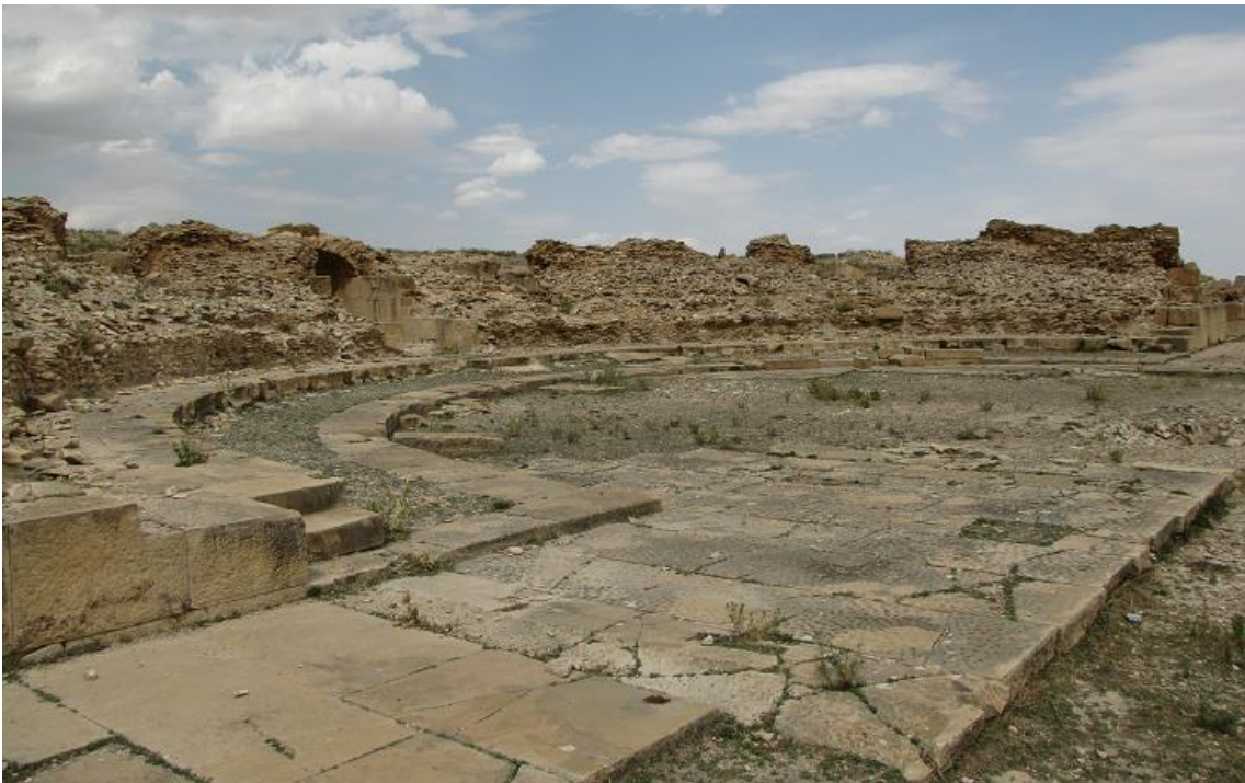
（劇場跡。2009年8月27日）