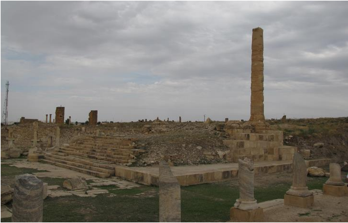
（カピトリウム跡。2009年8月27日）