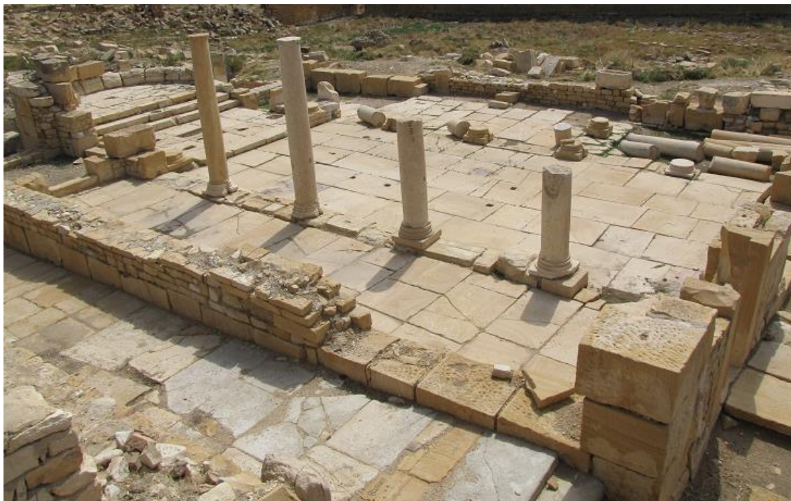
（教会堂跡。2009年8月27日筆者撮影）